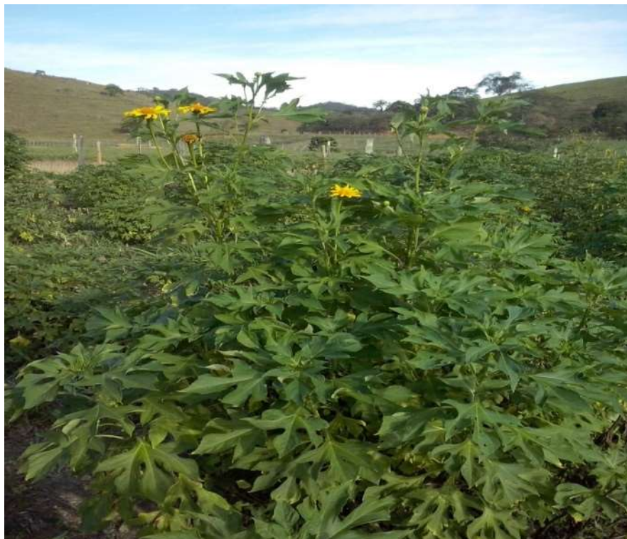
Figura 3- Aparecimento das flores de Tithonia diversifolia