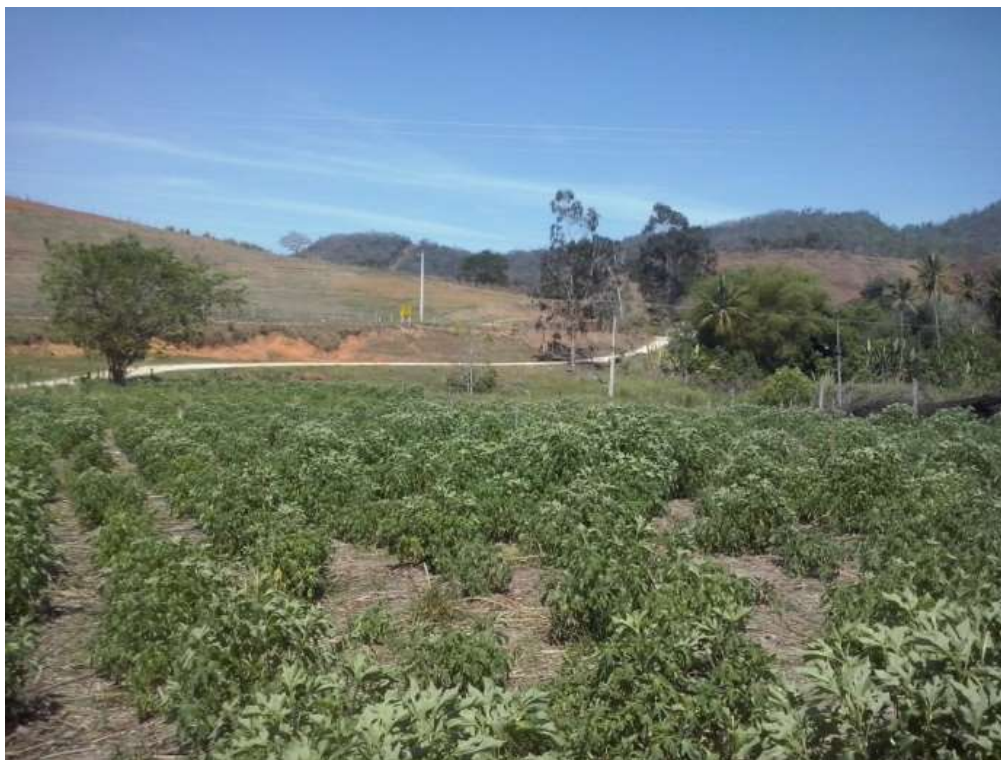
Figura 2- Canteiros experimentais

*o primeiro valor se refere ao espaçamento entre linhas e o segundo entre plantas.